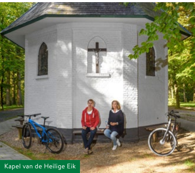
Kapel van de Heilige Eik

Bij de Heilige Eik, even ten noorden van het Wilhelminakanaal, moet je écht even van de fiets afstappen. In het begin van de 15e eeuw werd op deze plek een beeldje gevonden van de Heilige Maagd Maria en vervolgens in een eik geplaatst. Vlakbij deze eik is de kapel van de Heilige Eik gebouwd. Nog dagelijks bezoeken vele bedevaartgangers het kapelletje, dat prachtig is gelegen tussen imposante eikenbomen en de rivier de Beerze. Het waterschap heeft hier drie oude meanders schoongemaakt en weer terug aangesloten op de Beerze.