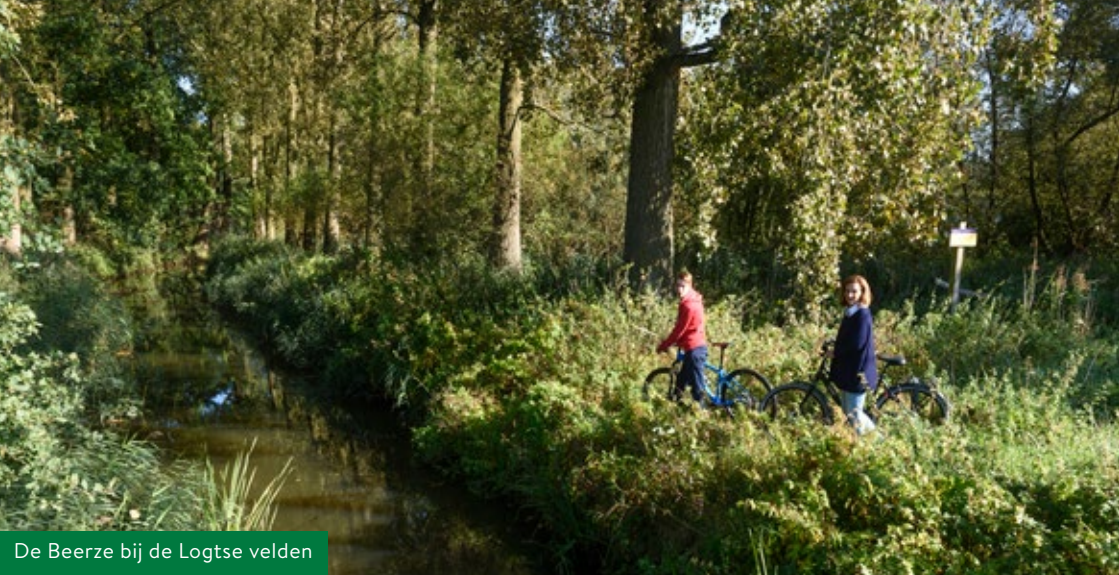
De Beerze bij de Logtse velden