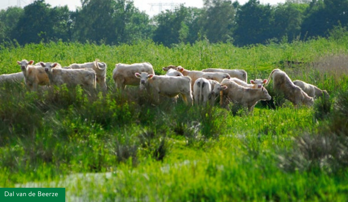
Dal van de Beerze